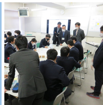
グループワークの様子

今後、出前授業を実施する際には、継続的に対象者に合わせた出前授業となるよう工夫していく。