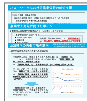
課題・問題点を整理した資料

また、資料提供を行った法人等のリスト及び農業法人等からの意見・要望などを山梨労働局と共有するなど、引き続き連携を図っていくこととしたい。