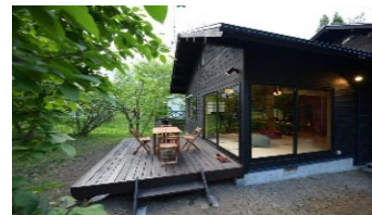
空き別荘を活用した農泊施設（農山漁村発イノベーション）の例