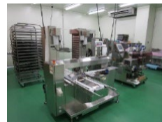
農林水産物処理加工施設