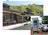
EV車等への給電設備