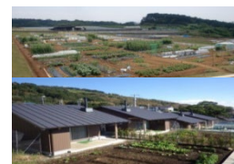
農作業の体験施設