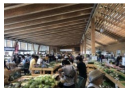
農林水産物直売所