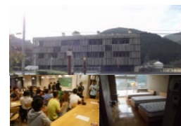
廃校を利用した交流施設