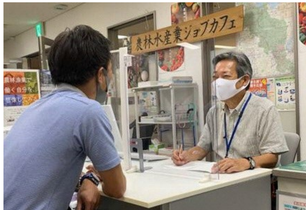
就農相談窓口「農林水産業ジョブカフェ」での相談風景

京都市南区東大条下殿田町70 京都テルサ西館3階 「京都ジョブパーク」内「農林水産業ジョブカフェ」 （近鉄京都線「東寺」駅・京都市営地下鉄「九条」駅から徒歩5分）