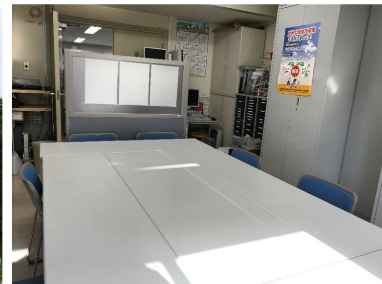
（公社）あおもり農業支援センター内