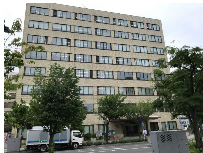
青森県共同ビル外観