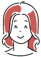
都市部在住の女性