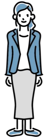
都市部在住の女性