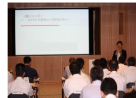
（人権問題啓発研修会）