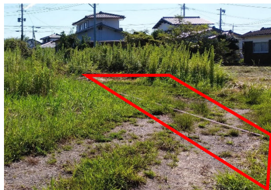
(出典) 2023年9月時点 (農林水産省撮影)