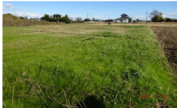
2023年11月時点