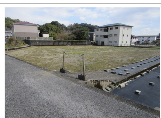
(出典) 2024年3月時点 (農林水産省撮影)