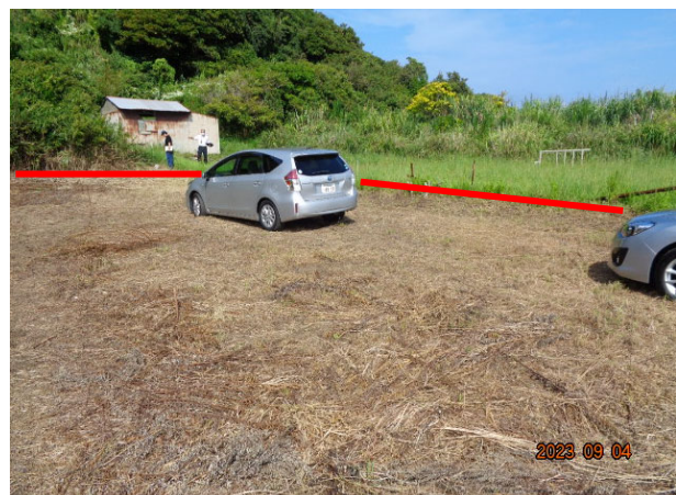
2023年9月時点