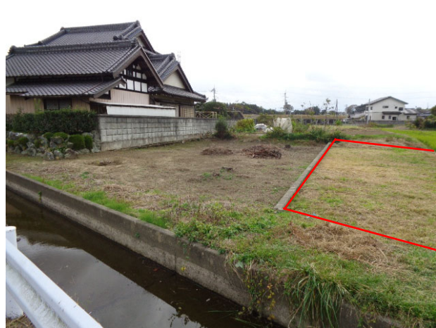
2023年11月時点