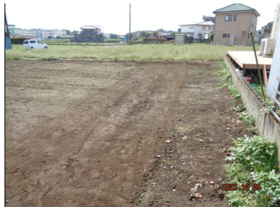
2023年10月時点