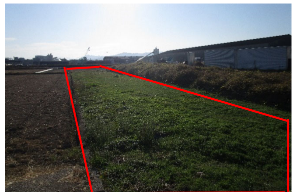
(出典) 2023年11月時点 (農林水産省撮影)