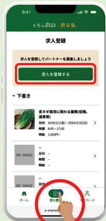
「求人登録」をタップ