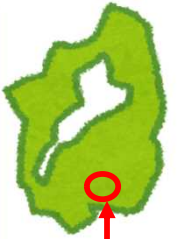
滋賀県 甲賀市水口町 北脇地区