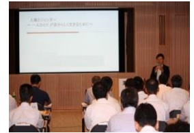
（人権問題啓発研修会）