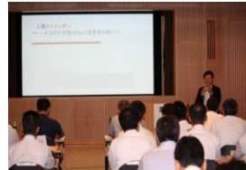
(人権問題啓発研修会)