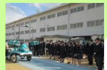
高校への出前授業