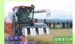
スマート農業のカリキュラム強化