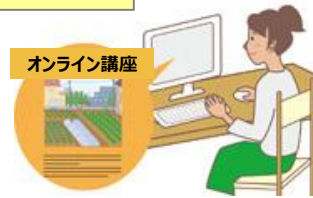
オンライン講座のコンテンツ作成・提供