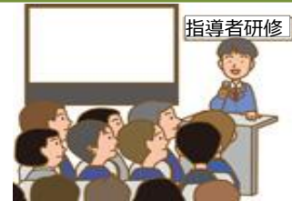
研修機関の指導者向け研修や学生向け研修の実施