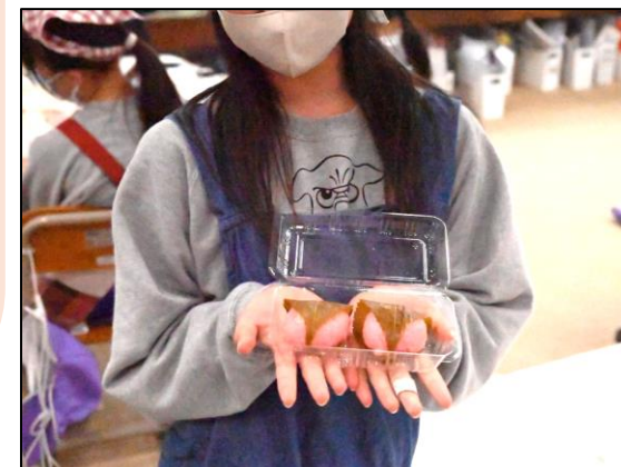
家庭科のできる桜餅！大切にお持ち帰り！