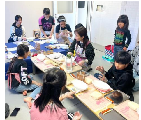
↑UJC柔術教室に通う小・中学生と保護者