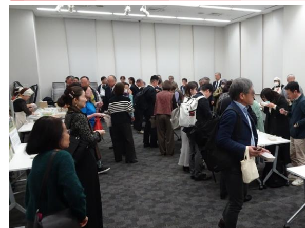
ワークショップのようす