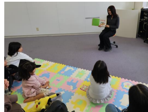
参加者に読み聞かせをする学生