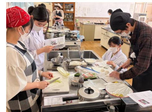
離乳食講座「作る」の様子