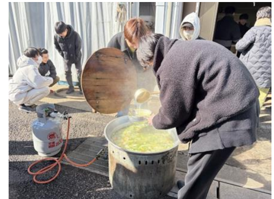
郷土料理『イナムドゥチ』を調理

東海学院大学 医療栄養学科の学生有志は、学内の食品残渣堆肥を活用した野菜栽培に取り組んでいます。「みえるらべる」三ツ星評価の規格外品（白菜、各務原にんじん）も利用し、沖縄出身学生の提案で郷土料理『イナムドゥチ』と『きんぎょ飯』を100名分調理し、毎年恒例の感謝祭を令和8年1月22日に開催しました。大鍋を囲んだ地域の方々や学生からは「収穫への感謝と郷土の食文化を味わう貴重な機会となった」といった声が寄せられました。