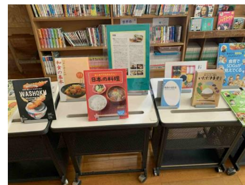
↑図書館所蔵の資料の別置の様子

栄養教諭はこの日の献立の説明と出汁に関するクイズ、学校司書はユネスコ無形文化遺産に認定されていることなどを放送しました。