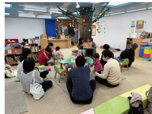
栄養教諭を目指す学生による和食を「知る」講座の様子

家庭で手軽に実践できる和の離乳食を提案しています。大学生の感性で和食の魅力を親子へ直接届け、地域と共に歩む食育を実践。次世代へ豊かな食文化を継承する一助となっています。