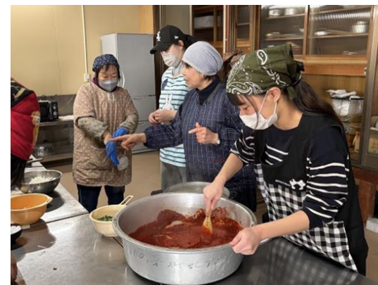
新郷土料理『各務原キムチ』を調理

東海学院大学 医療栄養学科では、学生が栽培した「みえるらべる」三ツ星評価の規格外品（白菜、各務原にんじん）を使用し、地域の方々から学生達が調理法や歴史を直接学び、共に作り、味わうことで、この新郷土料理を次世代へ継承していきます。今年度は令和8年1月15日に開催しました。