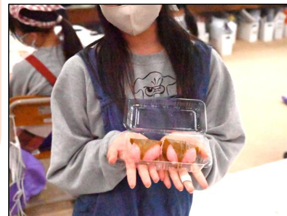
家庭科でできる桜餅！大切にお持ち帰り！