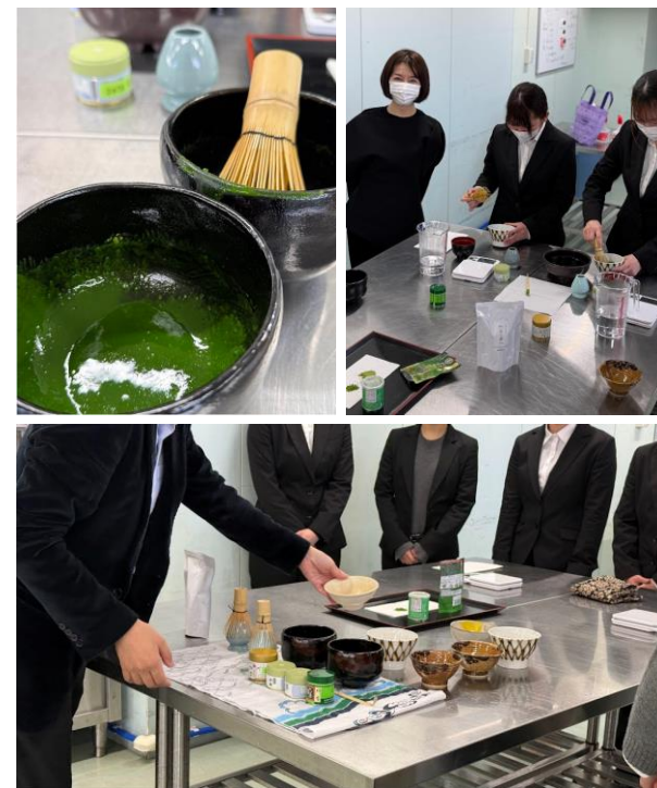
抹茶ワークショップの様子

手で触れ、味わい、知るという一連の体験を通じて、抹茶を単なる飲み物としてだけでなく、 和食文化を支える食材の一つとして理解を深める機会 となりました。