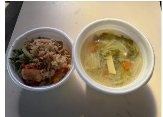
きんぎょ飯（左）とイナムドゥチ（右）