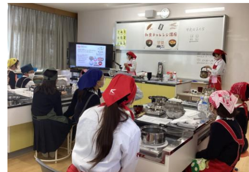
和食、だしに関する解説

生徒からは「家でも作りたい」「大学生と一緒によくわかった」などの感想が寄せられ、 和食の魅力 を楽しく伝える機会となりました。