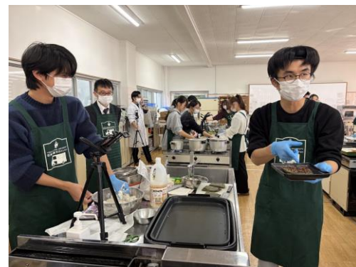
9品の郷土料理をみんなで作りました