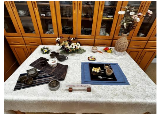
実習した和菓子と日本茶

参加者からは、「和食文化を子どもに伝えきれていないと思っていたので、こういう機会があるのが良かった」「また参加したい」などの感想が寄せられました。親子での実践を通して、和食文化を継承することの大切さを改めて認識する場となりました。