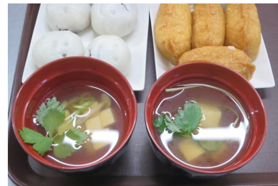
おいなりさん・饅頭・お吸い物など