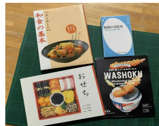
↑絵本や新書、英語で書かれた資料など