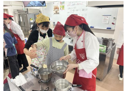
調理実習の様子（大学生が指導サポート）