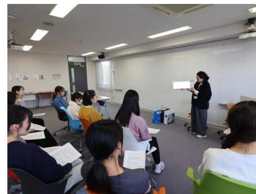
絵本専門士から講義を受ける学生

お問い合わせ先：楽し味プロジェクト事務局（washoku-pj@maff.go.jp）