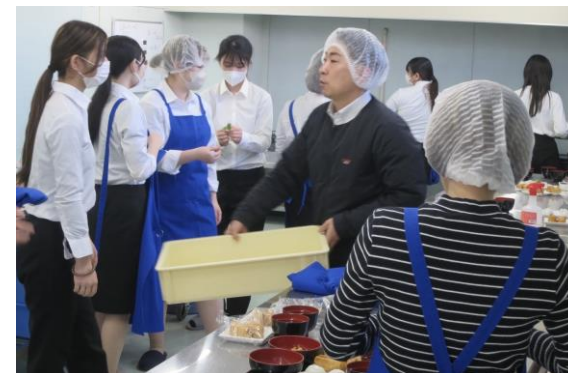
初午の行事食づくりを実施する様子

当協会監修による「和食を知る・作る・食べる」体験を通じて、 行事食と給食現場のつながりを学ぶ機会 となりました。