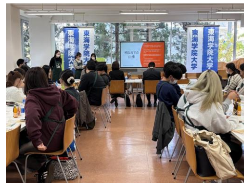
自分の故郷の郷土料理を紹介

イベントでは、学生らが出身地の郷土料理を共に作り食べることで、郷土料理・和食文化への理解を深めました。また、東海農政局による『日本食・食文化をめぐる情勢について』の講演も行われました。