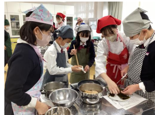
調理実習の様子（大学生が指導サポート）