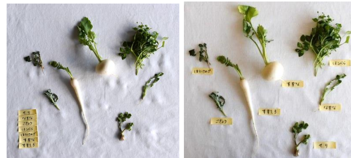
知る「どれがどの七草？クイズ」 皆で見て触って楽しんで考えました！

お問い合わせ先：野菜と雑穀の料理教室「べじつぶさろん」 ( https://www.instagram.com/vegsubusalon )