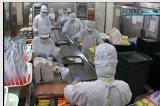
日本の病院食提供事業①