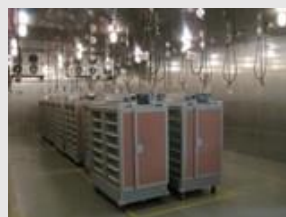
日本の病院食提供事業②