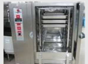
日本の病院食提供事業③