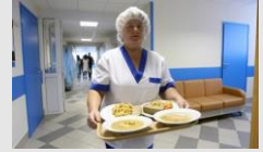
ロシアの病院での配膳(例)