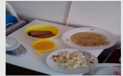
ロシアの病院食(例)