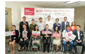
バンコク都内150店、地方86店の地元飲食店と連携し、「本物の [Made in Japan] を味わおう！」キャンペーンを実施 (タイ)