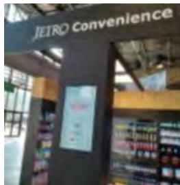
サブカルチャーの祭典Japan Expoで日本のコンビニ風の展示を行い日本産食材をアピール (フランス)

現地発の戦略の下、現地パートナーと連携しつつ、日本産同士の競合とならない 新たな商流を開拓。