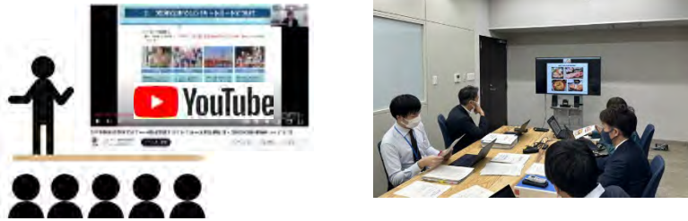
カントリーレポートの完成を受け、現地PFによるWEB説明会を開催。 (左) 全体レポート・ウェビナー (右) 品目別レポート個別情報交換会

市場・規制の全体像や変化など、現地発の有益な情報をカントリーレポートとして取りまとめ、品目団体や事業者が発信。 第1弾のレポートを令和4年11月22日公表。