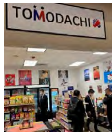
これまで接点のなかった米軍施設内でテストショップを開店 (アメリカ)