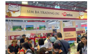
現地最大級の食品見本市にジャパンパビリオンを設置、日本の事業者70社以上の食品を出品し、現地バイヤーとの商談をアレンジ (ベトナム)