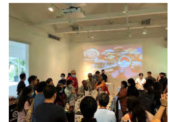
品目団体、複数都道府県と協力し、日本産米認知度向上イベントを実施 (シンガポール)