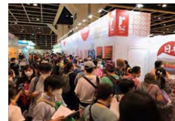
品目団体や現地事業者と連携して、食の大型展示イベントで日本産米のプロモーションを実施 (香港)

現地の流通に精通する 日系・非日系の現地事業者との連携を強化し 、商流構築や日本食普及を推進。