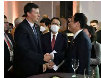
国連総会の機会を捉え、オールジャパンでの日本食・食文化、日本産食材と観光のプロモーションイベントを開催 (アメリカ)

新たに設ける「都道府県・輸出支援プラットフォーム連携フォーラム」などで都道府県等の意向を把握した上で、現地主導によるオールジャパンでのプロモーション活動を実施。