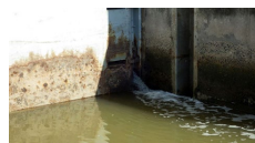
既存水門から流入する塩水