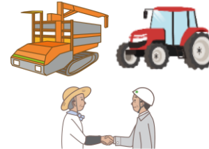
農業用機械のリース費