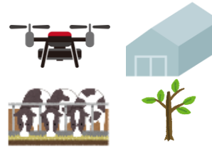
機械・施設、家畜、苗木等の購入費