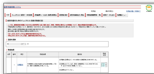
[ 経営改善実践システムの画面 ]

入力方法がわからない場合は、農林水産省ホームページにある「経営改善実践システムの操作マニュアル」を参照してください。