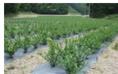
<抹茶原料等の生産に向けた栽培転換>