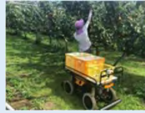
(例) 自動追従システム+省力樹形・園地整備による栽培管理の効率化 [果樹・茶]