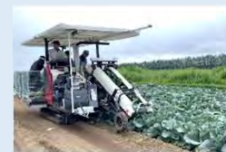
(例) 高温障害の影響を低減する生育予測システム+機械による一斉収穫 [露地野菜]