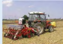
(例) 自動操舵システム+直播栽培による作期分散 [水稲]