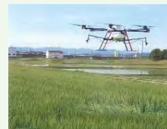
[例] スマート農業機器の活用