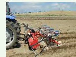
大豆300A技術（不耕起播種栽培など）