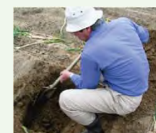
土壌診断に基づく土づくり