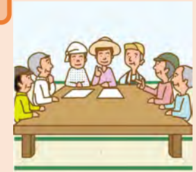
生産性向上の推進 (定額)