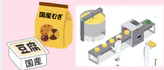
新商品の開発等 (定額、1/2以内)