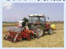
(例) 自動操舵システム + 直播栽培による作期分散 [水稲]