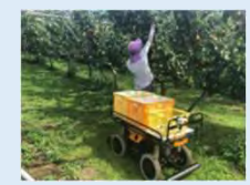
(例) 自動追従システム + 省力樹形・園地整備による栽培管理の効率化 [果樹・茶]