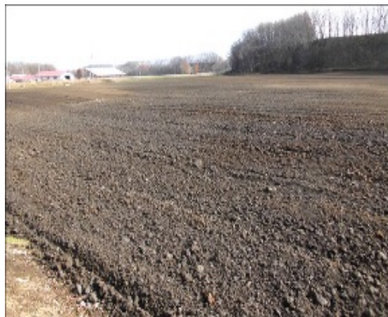
査定前着工により復旧した農地