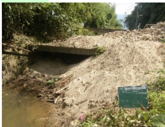
土砂が堆積した水路