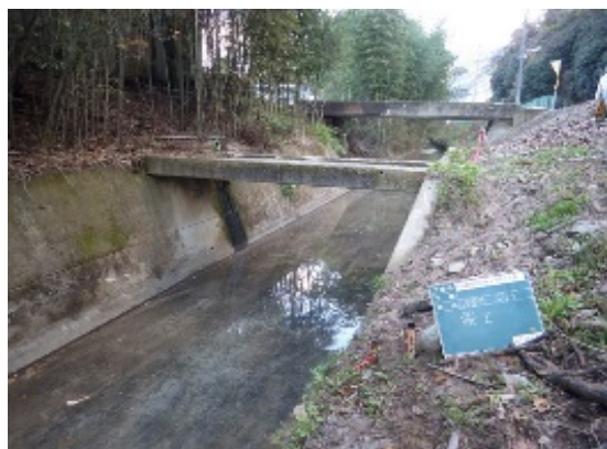
査定前着工により復旧した水路