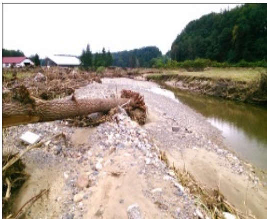
豪雨による河川増水で被災した農地