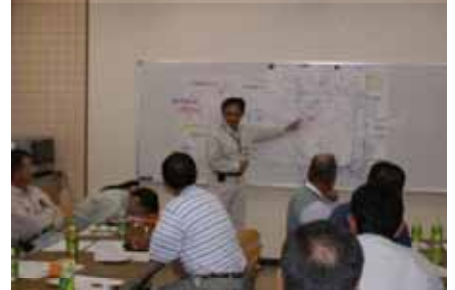
地域防災ワークショップへの参加 (助言)