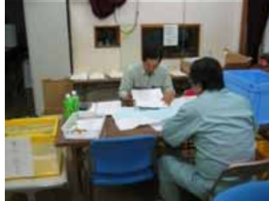
査定設計書作成への助言