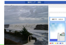
沿岸監視カメラ・越波情報提供システムの整備