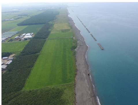
農地を守る離岸堤