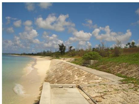
緩傾斜護岸整備状況

国民経済上、及び民生安定上重要な地域において、波浪による海岸の侵食等を未然に防ぐことにより、国土の保全に貢献します。