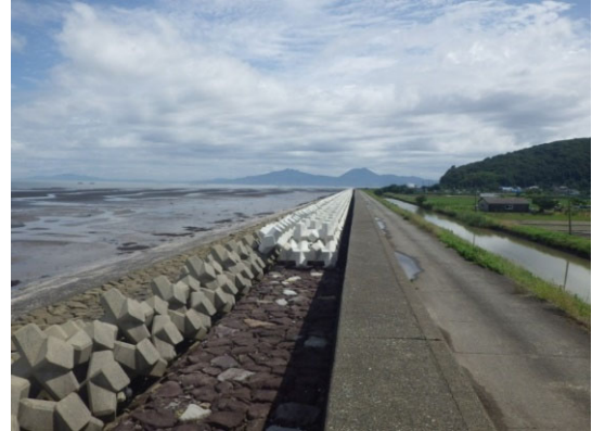
消波ブロック整備状況