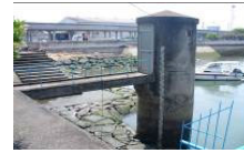
潮位計等の観測施設の設置