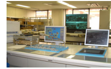
データ収集・処理 ・伝達システムの整備