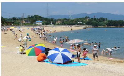
整備された海岸の利用状況