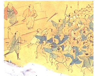
満濃池の江戸時代の工事の様子 (満濃池地堅之図)