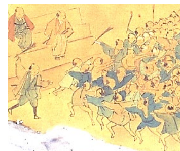
満濃池の江戸時代の工事の様子 (満濃池地堅之図)