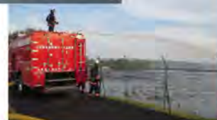
図 11 台風・洪水による水上設置型太陽光発電設備の事故事例