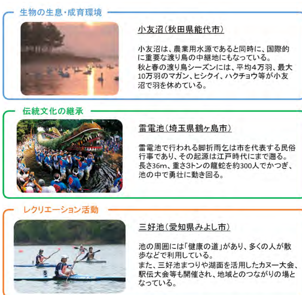
図9 ため池のもつ多面的機能の事例