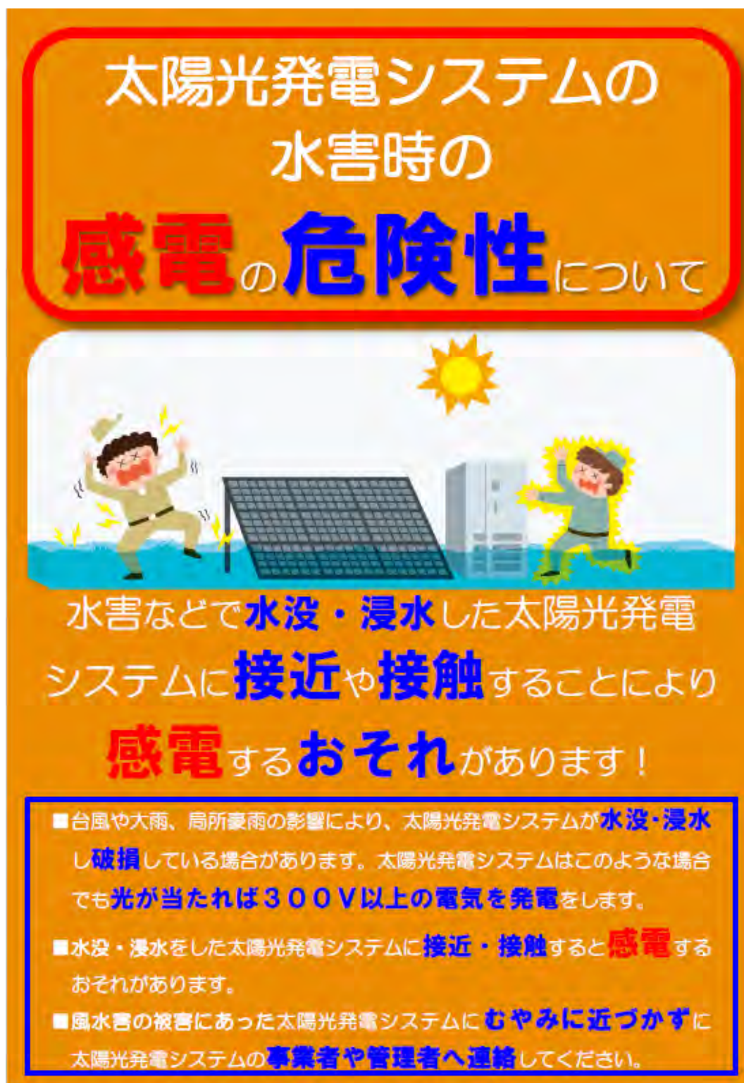
図 10 水害時の感電の危険性を呼びかけるパンフレット (国立研究開発法人新エネルギー・産業技術総合開発機構 (NEDO) が作成)