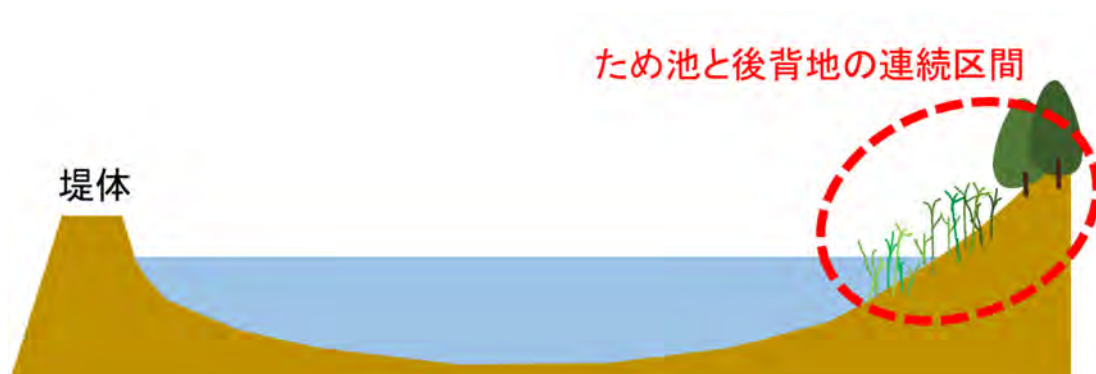
図7 環境配慮範囲（土地改良事業設計指針「ため池整備」を元に一部加工）

ため池の整備時における環境配慮範囲は、堤体部分のみならず、ため池と後背地の連続区間も対象となります（「土地改良事業設計指針「ため池整備（案）」より）。