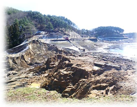
平成23年3月の東日本大震災により決壊（福島県）