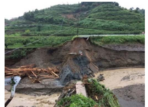
平成29年7月の豪雨により決壊（福岡県）