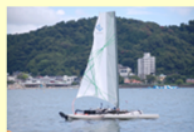
無人帆走ドローン