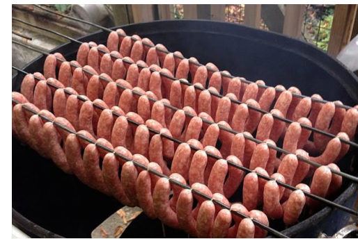
<ジビエを使ったソーセージ作り教室>