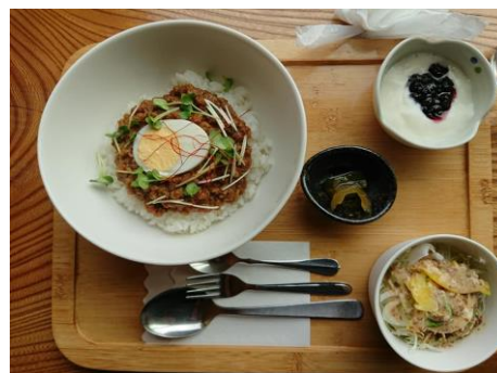
<三好市内カフェにて提供されている「鹿肉のキーマカレー」>