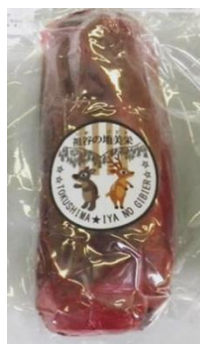
<真空パックされたシカ肉>