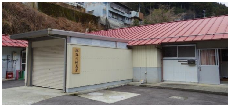
<食肉処理施設「祖谷の地美栄」>