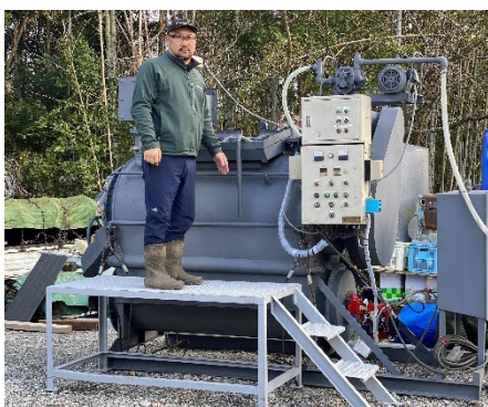
<5時間で堆肥化する機械>