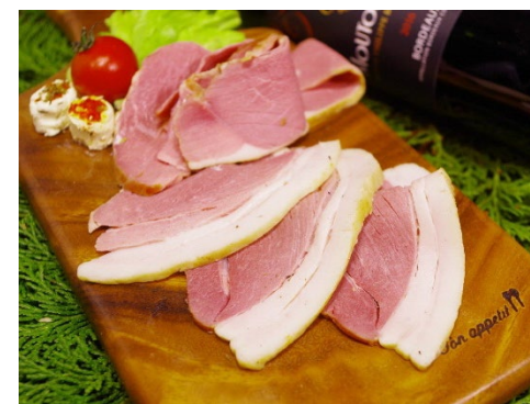
<九州ジビエと冠したイノシシ肉>