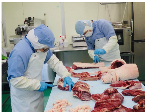
<施設内での精肉加工の様子>