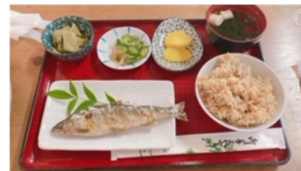
↑ 味工房じねんで食べた鮎の塩焼き定食