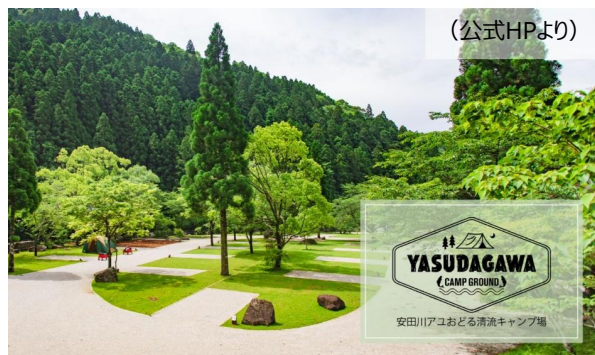
↑ 安田川アユおどる清流キャンプ場