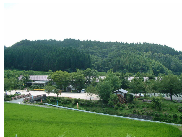
旧「花の温泉館」を「WAQUA UBUYAMA」に改称し、民間事業者による管理・運営を開始