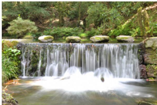
村の水道にも使われる池山水源