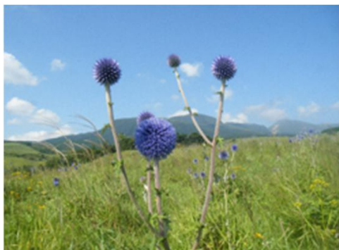
絶滅危惧種の村花ヒゴタイ