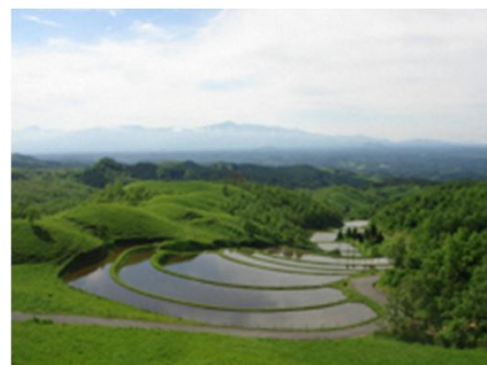
湧水で育てる棚田百選「扇棚田」