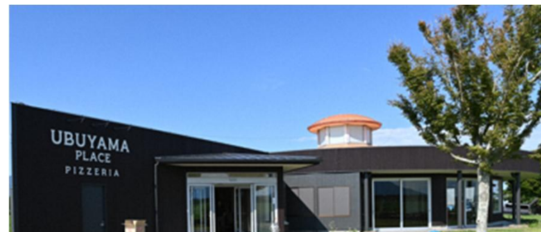
R6にリニューアルし、人気のレストランとなった観光牧場