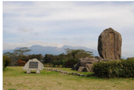
阿蘇、九重、祖母を望む一覽三山の台