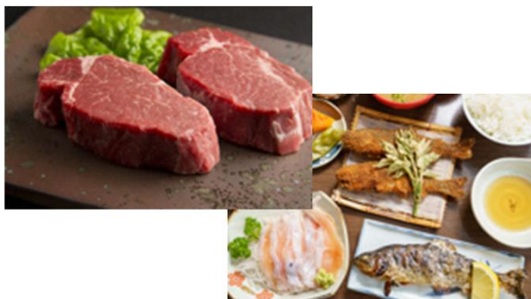
あか牛やヤマメ料理で観光客をおもてなし