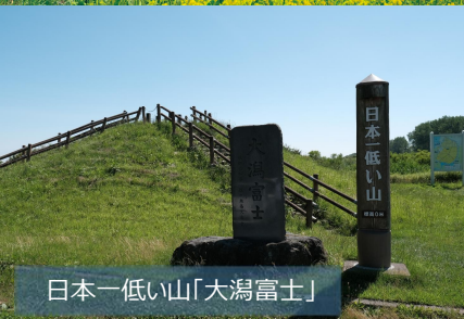
日本一低い山「大潟富士」