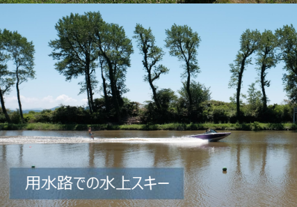
用水路での水上スキー