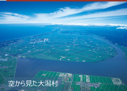
空から見た大潟村