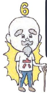
ロクジカ仙人ろくじい