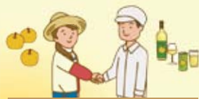
農林漁業者と食品産業事業者が連携し、新商品の製造・販売に取り組む