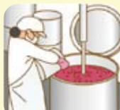
農林水産物の加工に取り組む

六次産業化法等により認定を受けた農林漁業者等が農林水産物の高付加価値化等を図るために必要な機械・施設の整備を支援することにより、農林漁業者等による6次産業化を強力に推進し、農山漁村における雇用の創出と所得の向上を図る。