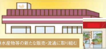
農林水産物等の新たな販売・流通に取り組む