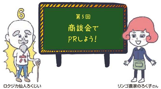
ロクジカ仙人ろくじい