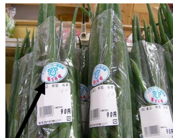
エコファーマーシールを貼った野菜を直売所で販売