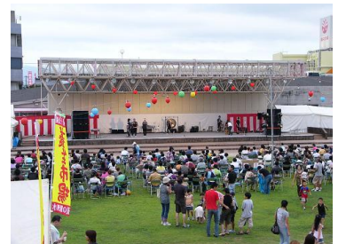
泗水夏祭りの様子