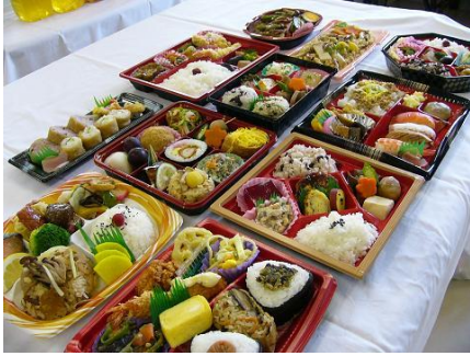
「道の駅弁」新作発表会を毎年開催