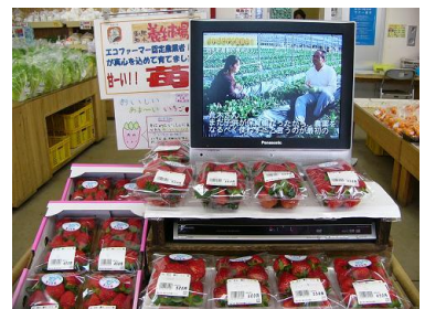
生産現場のビデオを直売所内で放映