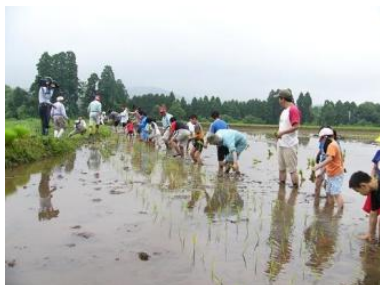
会員農家の協力を得て田植えやぶどう狩り体験を企画・運営