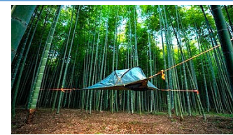
竹林の景観を活かした キャンプ事業の創出