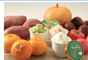
地域の農林水産物で 新商品を開発